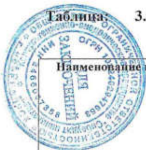
Таблица 3.5 Наличие и движение дебиторской задолженности за 2023 г.